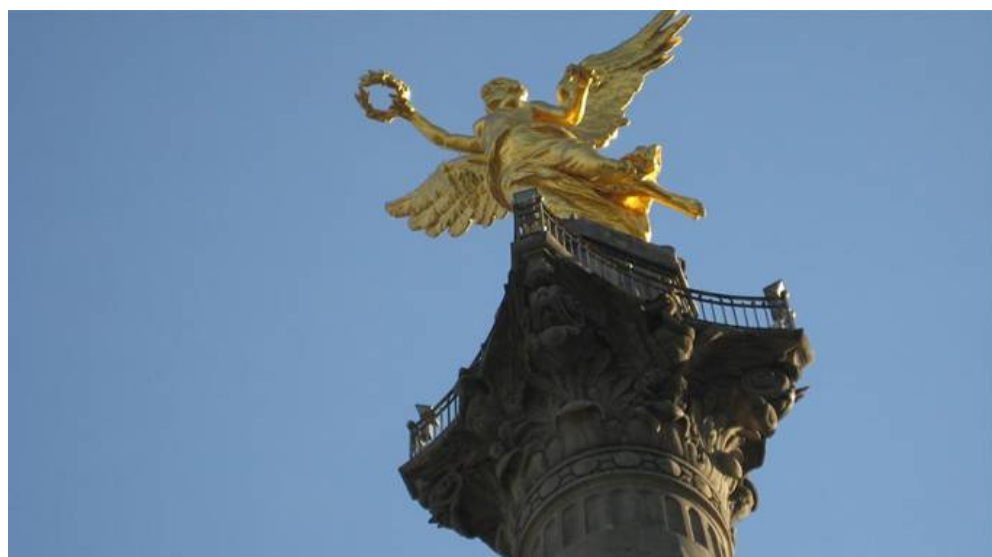
Monumento del Ángel de la Independencia, en Ciudad de México.